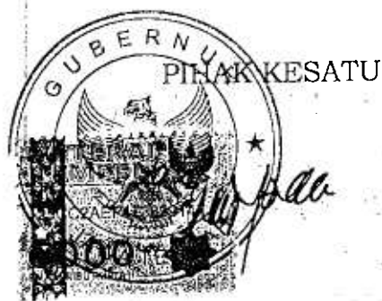
H. GANJAR PRANOWO

Demikian Perjanjian Hibah Daerah ini dibuat dengan itikad baik untuk dapat dipatuhi dan dilaksanakan oleh PARA PIHAK.