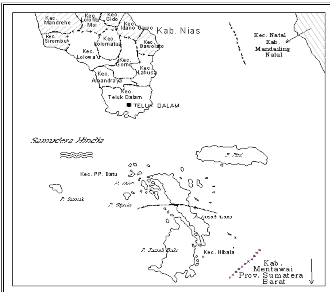
PETA KABUPATEN NIAS SELATAN